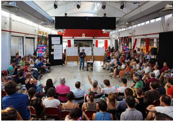
↑ Un esempio di Plenaria