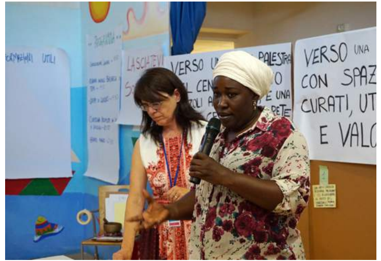
↗ Una delle proposte emerse durante gli incontri

Con gruppi di lavoro coordinati da Quartieri e Ufficio Immaginazione Civica, insieme ai tecnici del Comune e con la supervisione dell'Università di Bologna, gli autori delle proposte e chi ha espresso la propria disponibilità, approfondiranno le idee in campo, analizzando possibili sinergie e criticità creando di fatto un percorso comune diffuso su tutto il territorio del comune di Bologne mettendo insieme chi ha progetti e chi dovrà seguirne l'attuazione.