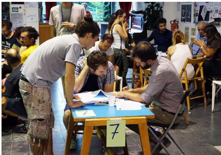
↓ Dettagli da alcuni gruppi di lavoro

Al termine di questa fase, per le proposte del bilancio partecipativo che avranno superato le analisi di fattibilità, è previsto una fase di democrazia diretta con il voto on line. Per gli edifici PON Metro, pubblicheremo delle proposte di vocazioni d'uso mentre, quartiere per quartiere, verranno prodotte delle linee guida con le priorità.